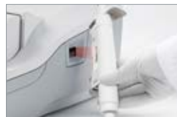
2. ピペットをスキャン