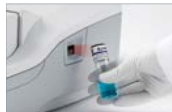
3. キャリブレーション溶液のスキャン