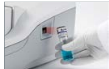
3. キャリブレーション溶液のスキャン