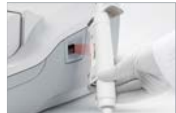
2. ピペットをスキャン